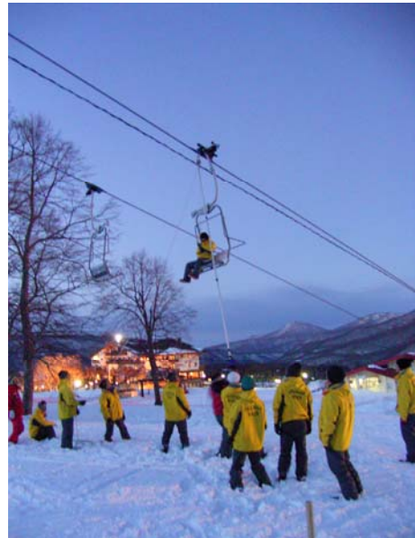
▲12月29日 第2高速ペアリフト